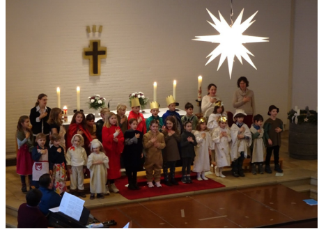
Krippenspiel mit Kinderchor und Krippenspielkindern