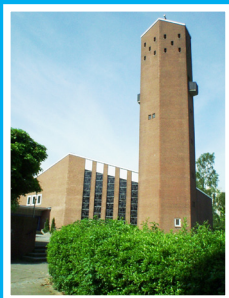
Heilandskirche Saarbrückenstr. 46