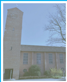
St. Jürgen-Kirche Königsweg 78 vermietet an die FeG Kiel